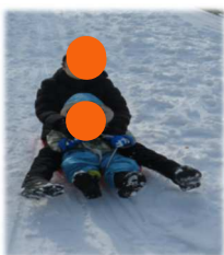
水や雪でも 遊ぶよ！