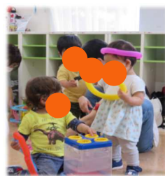
室内での遊び 友だちできた！